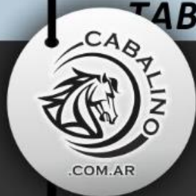
TABLA DE MEDIDAS APROXIMADA REMERAS